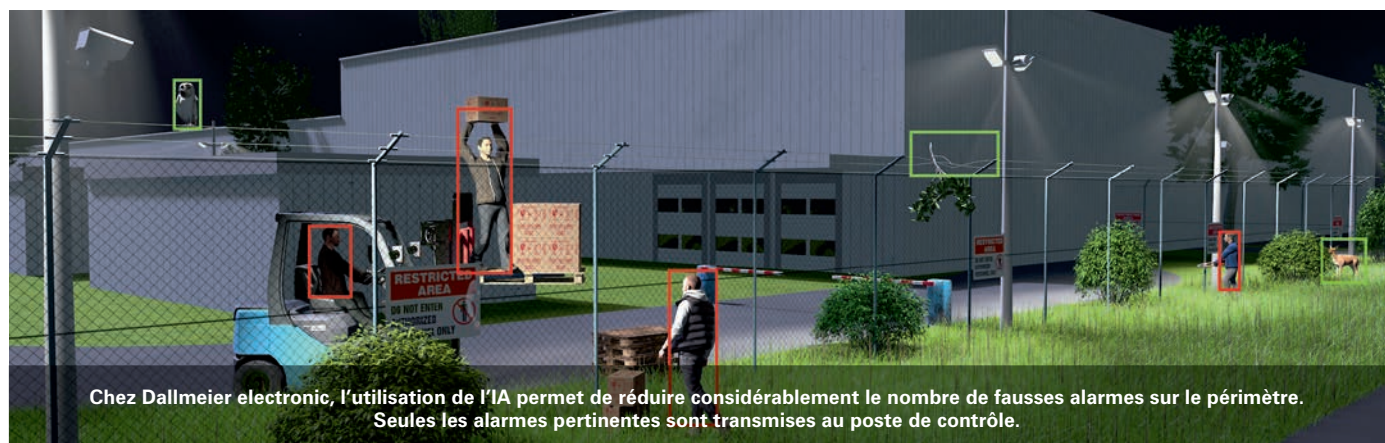
Chez Dallmeier electronic, l'utilisation de l'IA permet de réduire considérablement le nombre de fausses alarmes sur le périmètre. Seules les alarmes pertinentes sont transmises au poste de contrôle.

Autre constat : choisir la bonne technologie permet d'éviter de nombreuses erreurs dans les opérations de vérification. « Par exemple, des caméras modernes intégrant des systèmes de "capteurs multifocaux", comme le système Dallmeier Panomera, se distinguent de la combinaison classique "caméra mo- ● ● ●