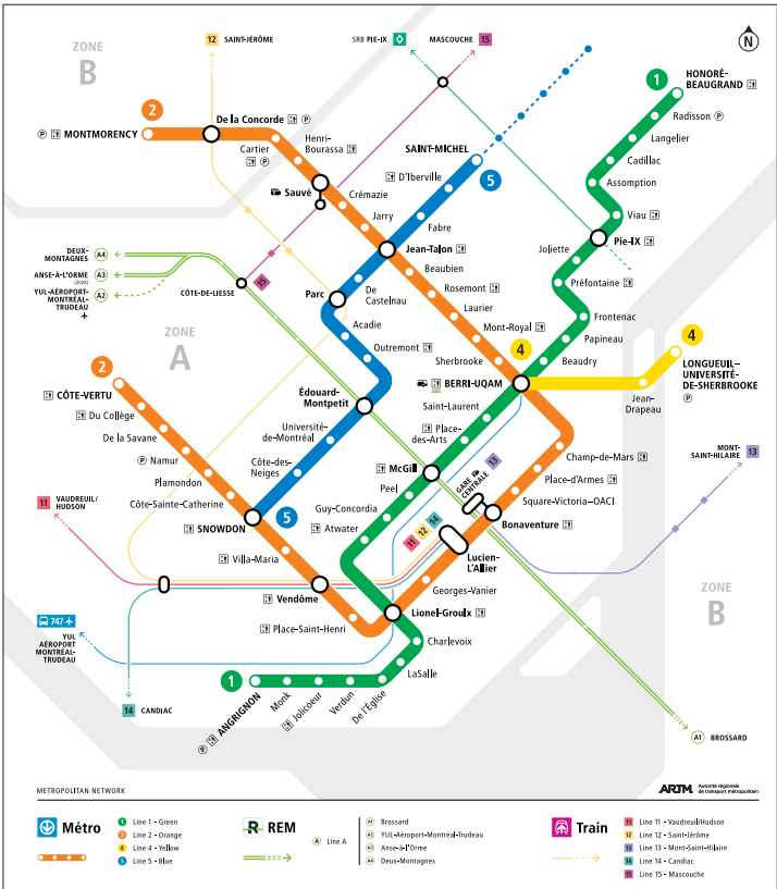
Figure 2 Plan du métro de Montréal (STM)